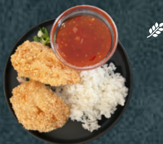
B.4 Friterad kyckling med ris och sötsursås.