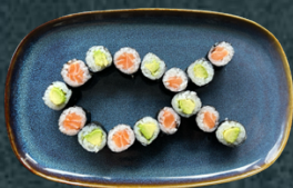
B.1 Hosomaki: 8 lax, 8 avokado