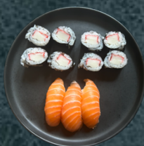
B.2 Hosomaki: 8 surimi Nigiri: 3 lax eller sotad lax