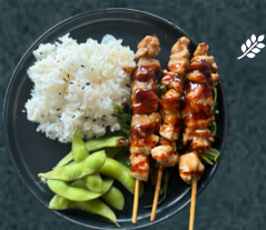
B.3 Yakitori kyckling (3st) med ris och edamame.