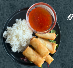
B.5 Vegetariska vårrullar med ris och sötsursås.